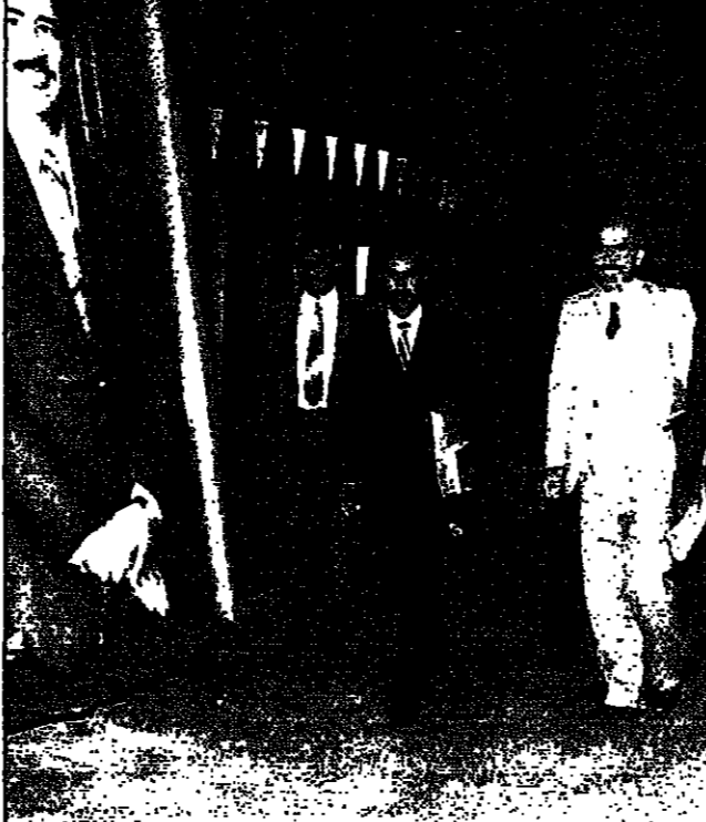
سبعة من أسرى الحرب العراقيين لدى وصولهم إلى بغداد قادمين من طهران